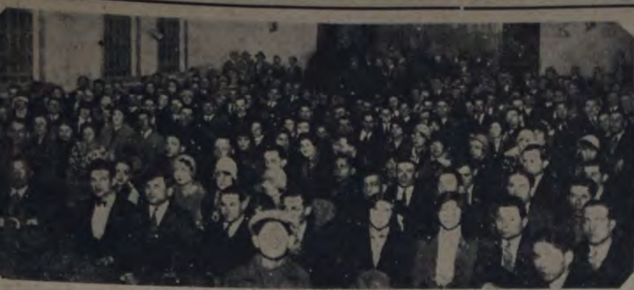
Organizado por la U. O. Cortadores, Sastreres, Costureras y anexas, se realizó anoche, en la Casa del Pueblo, un mitin que estuvo muy concurrido, de solidaridad con los obreros de la sección Villa Crespo, en conflicto con un grupo de patronos reaccionarios.